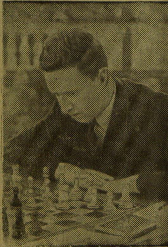
Гроссмейстер В. Смыслов.

В целом первенство закончилось большими достижениями молодежи. Мастера Ефим Геллер и Марк Тайманов отстали от победителей всего на пол-очка. Интересно от-